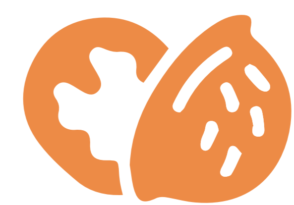
coji de nuci, coji de semințe

Biomasa agricolă, combustibilul de încălzire adecvat pentru: